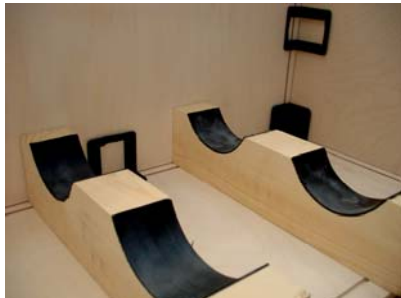
Extra stöt, glid och ytskydd med cellgummi