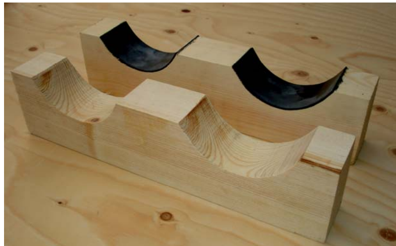
Exempel på fixering för axlar

Win Innovation utvecklar, designar och tillverkar träfixeringar för produkter, i box förpackningar.